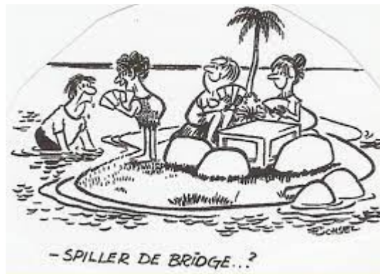
- SPILLER DE BRIDGE... ?